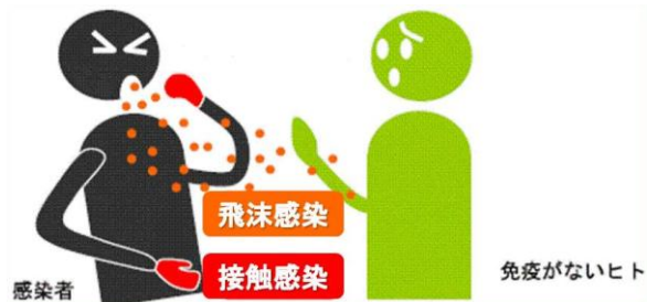
図1 新型インフルエンザの感染経路