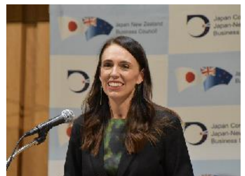
ジャシンダ・アーダーン NZ 前首相