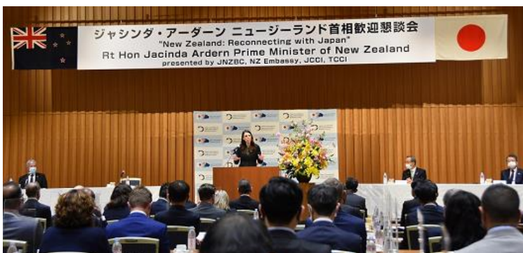
会場の様子：東商渋谷ホール

東商、日商、ニュージーランド大使館とともに「ジャシンダ・アーダーン ニュージーランド首相歓迎懇談会」を開催した。アーダーン首相はコロナ禍以来初の外遊先の一つとして日本を訪問。会場にはニュージーランド側からアーダーン首相をはじめ、ダミエン・オコナー貿易・輸出振興大臣やヘイミッシュ・クーパー駐日大使ら約80名、日本側から市川委員長（住友林業会長）や小林健顧問（三菱商事相談役）ら約30名が出席。さらにオンラインでも200名以上が参加した。