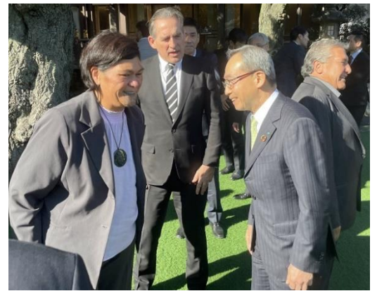
マフタ大臣と談笑する市川委員長