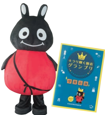
世田谷区商店街連合会の 人気キャラクター「が〜やん」

太子堂2-16-7 世田谷産業プラザ 2階 TEL: 03-3414-1432 http://www.ukiuki-setagaya.com