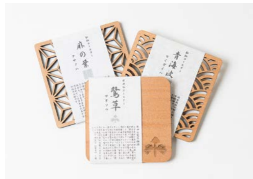
世田谷みやげに指定された「世田谷コースター 鷺草」(手前)

この技術の高さを一般のお客様にも提供できないかと試行錯誤を繰り返し、ギフト・記念品の製作が始まりました。細かく彫ることのできるレーザー彫刻機の特性を活かし、ガラスに写真やオリジナルのデザインを彫刻。今までになかったガラスの名刺を作ることに成功しました。その他にも、木やコルクに彫刻を施した記念品など、多彩なオリジナルグッズを展開。