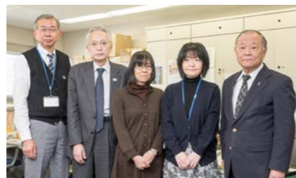
商店街の活性化に向けて多彩な活動をされている世田谷区商店街連合会事務局の皆さん

新たな取り組みとして注目を集めているのが、本紙の特集でも取り上げている「世田谷キラリ輝く個店グランプリ」です。区民の皆様から、区内のお気に入りの個店を推薦いただき、それを中小企業診断士や商店街関係者などからなる審査会が「店舗デザイン」「商品力」「接客」などの視点で検討しグランプリを決めるというもの。審査員が身分を明かさずに実際に店舗を訪問するなど、厳正なる審査を実施。第1回目となる今回は、150店舗の応募があり、1月にグランプリ店が発表されました。「世田谷キラリ輝く個店グランプリ」は区民の皆様からの反響も多く、ノミネートされた店舗からも励みになると大変好評で、これからも規模を拡大して進めていくとのこと。世田谷区商店街連合会では今後も各種取り組みを通して、個店の商店街への加入を促進し、様々な角度から商店街のサポートを行っていきます。