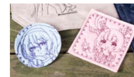
話題のフリフリ系ファッション(上) 新しく始まったイラスト縫い(下)