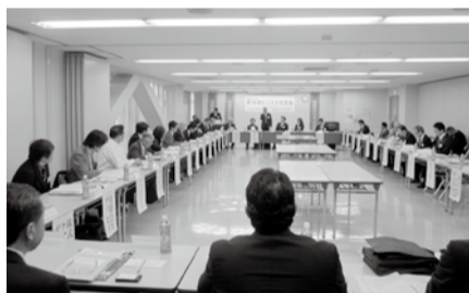
第一部の自社PRスピーチの様子

参加者全員による自社PRのスピーチを行いました。第二部では、フリーの立食形式で、名刺交換や懇談が活発に行われました。参加者は、積極的に名刺交換、情報交換を行い、ビジネスチャンスの拡大に役立てていただける会となりました。参加者からは、「横のつながりを作ることができた」、「今後も積極的に参加したい」などの感想が寄せられました。引き続き、東京商工会議所世田谷支部は会員間のビジネス交流の機会を提供していきます。