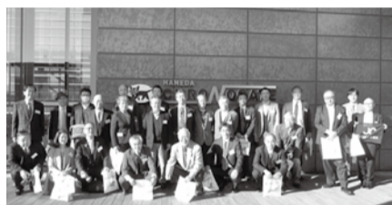
ヤマトグループ最大級の物流拠点「羽田クロノゲート」

続いて、羽田空港国際線ターミナル内に2014年9月に開業した日本初のトランジット機能(航空機を乗継時に出入国手続きをせずに宿泊可能)を有する「ロイヤルパークホテ