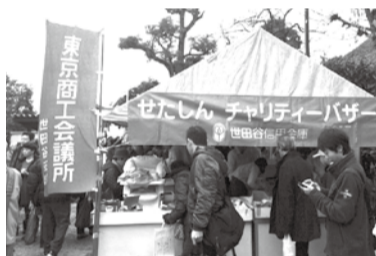
多くの人で賑わうチャリティバザー

ご協賛をいただきました企業の方々には厚くお礼申し上げます。今後ともご支援、ご協力を賜りますようお願いいたします。