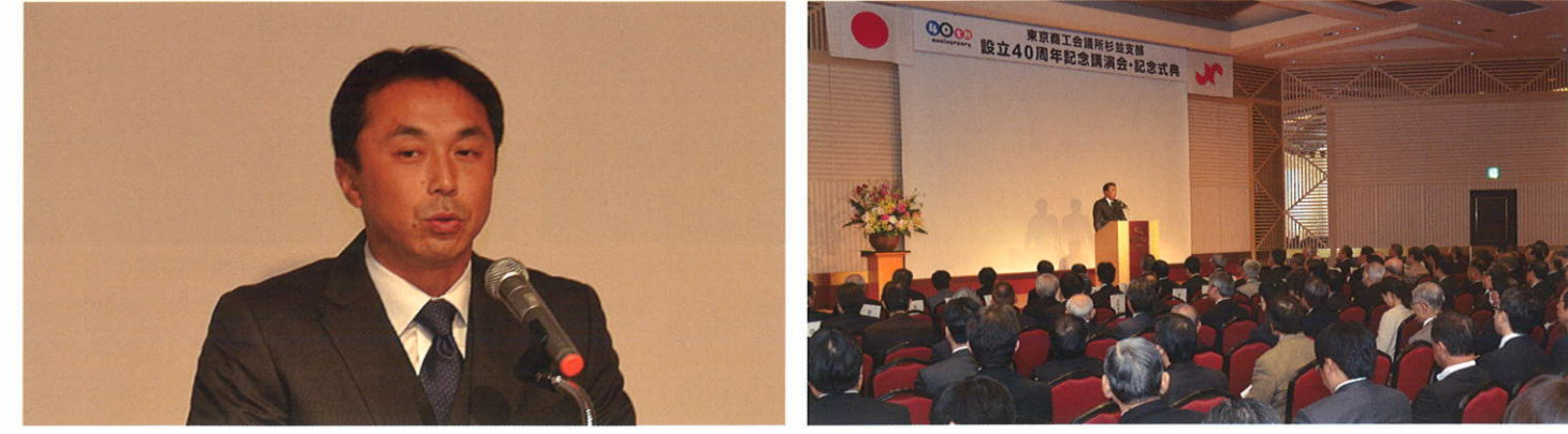
式典に先立ち、元東京ヤクルトスワローズの宮本慎也氏の講演会を開催

【発行所】 東京商工会議所 杉並支部 〒167-0043 杉並区上荻1-2-1 インテグラルタワー2階 TEL. 03-3220-1211 FAX. 03-3220-1210 https://www.tokyo-cci.or.jp/suginami/