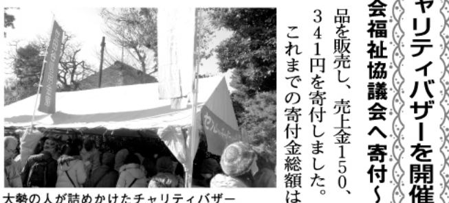
大勢の人が詰めかけたチャリティバザー

「せたがやポロ市」でチャリティバザーを開催 収益金を世田谷区社会福祉協議会へ寄付 東京商工会議所世田谷支部では、平成9年から毎年12月15日・16日に開催される「世田谷のポロ市」においてチャリティバザーを実施しています。このバザーでは、会員企業より物品の協賛をいただき、ポロ市会場にて販売、売上金を世田谷区社会福祉協議会に寄付しています。 平成25年12月15日・16日に実施したバザーでは、23社から寄贈いただいた商品