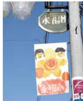
永福小生徒の作品がフラッグに