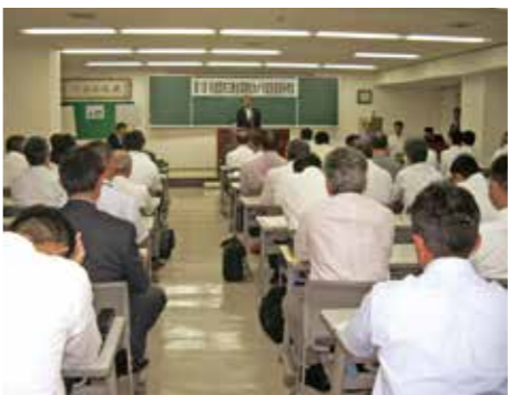
防犯カメラ促進3団体による合同研修会

まずは、「高井戸警察署管内防犯カメラ促進協力会」の活動が挙げられます。同協会は、同じく区内にある防犯カメラの設置促進を目的とする団体「荻窪ビル防犯協力会」「杉並警察ビル防犯協会」に続いて、今年4月に設立。高井戸警察防犯協会の下部組織として設立された点が、他の2つとは異なる点と言えます。住宅地と商業地が重なる京王・井の頭線地区なので、あ