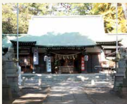
下高井戸八幡神社の本殿

会社は1961年創業。地域密着で建物の設計・施工・管理を行っています。大切にしているのは「業(わざ)」。「先代のお父様が社名を「佐藤建業」にしたのも「業」の字にこだわった所以。良い技術者と良い仕事を続けることを心がけ、社内でも資格取得のための援助をするなど人材育成に注力しています。