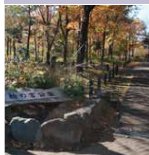
表紙写真：柏の宮公園