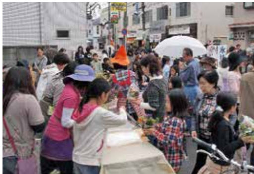
永福町オータムフェスティバルの様子