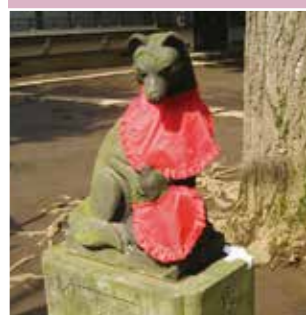
表紙写真：松庵稲荷神社