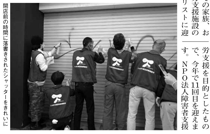
開店前の時間に落書きを消したシャッターをきれいに