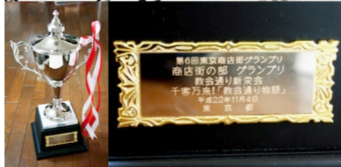
「教会通り物語」はコチラからご覧になれます。 http://www.kyokai-dori.com/youtube.html