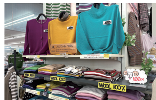
季節に合わせた冬物の商品が所狭しと店内に並びます