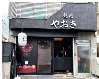
富士街道沿いにある店舗の外観