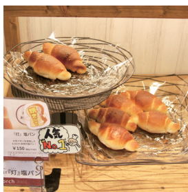
人気No.1の塩パンは大豆バターたっぷりのやさしい味♪