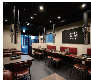
高級感あふれるハイセンスな店内。個室もあります