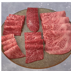
上質な部位を少しずつ楽しめる「やおき特選盛り合わせ」