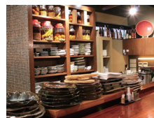
落ち着いた雰囲気の内店

極ダイニング清水 練馬区東大泉 1-27-17 飯島第3ビル1F ☎ 03-3867-2667