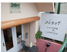
石神井公園店のおしゃれな外観

デビュー 大泉本店 練馬区東大泉 1-27-24 2F ☎ 03-3923-8988