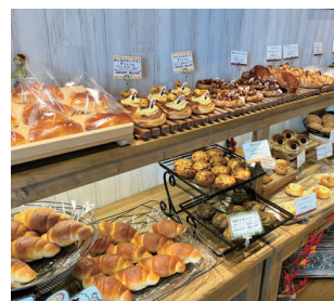
パンと焼き菓子など合わせて常時70種類ほどの商品が並びます