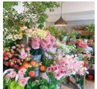
店内の様子。月に2日間のみ完全予約制の花屋をOPENしています