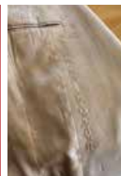
就活、お見合い、選挙など「ここぞ！」という時に成就率が高い「ご祈禱スーツ」