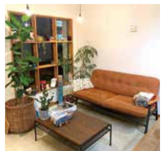
ゆったりとした時間を演出するインテリア