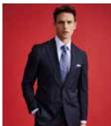
スカバル (SCABAL) のシングルジャケット