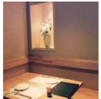
木の温もりを感じる店内