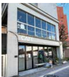
店名は「君に幸あれ」という意味