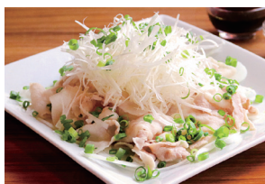
「出汁しゃぶしゃぶネギまみれ」は、「恋する豚研究所」の豚肉を使用