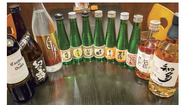
アルコールは、日本酒をはじめワインや焼酎など厳選した銘柄が揃っている