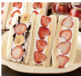
いちごの「フルーツサンド」は、バリエーション豊富！