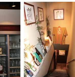
地下にも続く客席あり！まさに大人の隠れ家