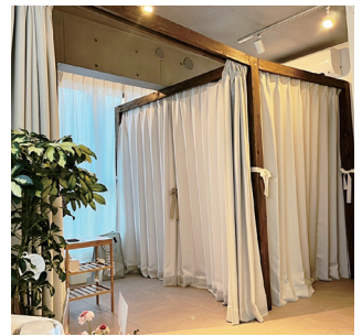
江古田駅南口から徒歩2分、よもぎ蒸し初体験の方もお気軽に！