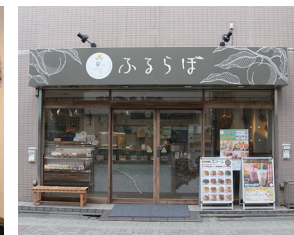
ふるらぼの外観。店内にイートインスペースもあります