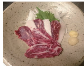
熊本県「千興ファーム」直送の馬刺し