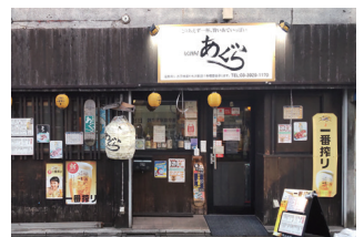
おすすめのメニューがズラりと貼り出された外観