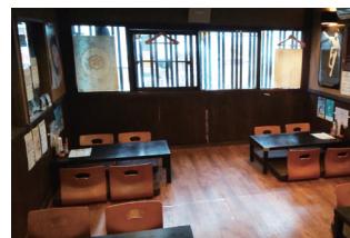
グループや家族連れもくつろげるお座敷席