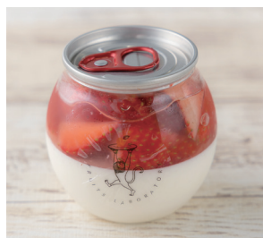
旬のいちごとパンナコッタが2層になった「パンナコッタ缶いちご」