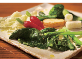
日替わりでおすすめ野菜が盛り込まれた「練馬野菜のサラダ」