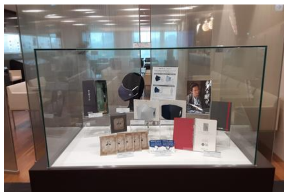
※イメージ（展示物は異なります）

※10名以上でお越しの場合は、事前に渋沢 記念事業推進プロジェクトチーム（オフィス 環境部内 03-3283-7857）までお問合せ ください。