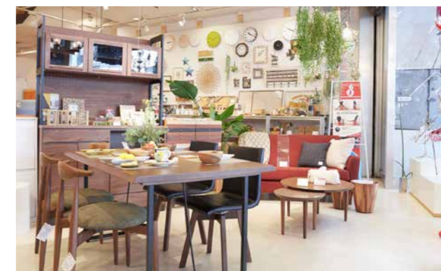
家具の他にも多彩な生活雑貨を取り扱っている