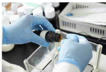
様々な成分を調合し調香師が香りを作っていく