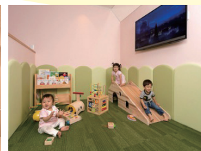
高松店のキッズスペース