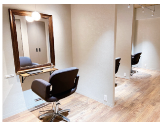
シンプルでおしゃれな店内