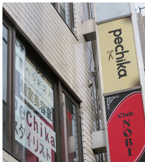
ベージュの看板が目印