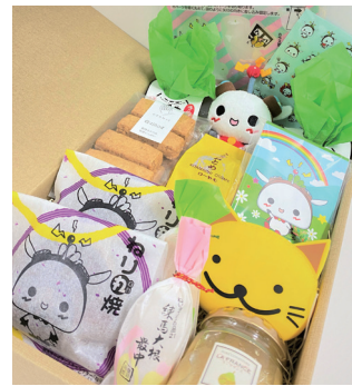
ご希望の予算に合わせて詰め合わせができるオリジナルギフト