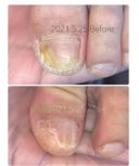
爪の黄ばみや変形をケア