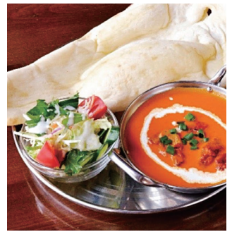
バターチキンカレーとナンのセット