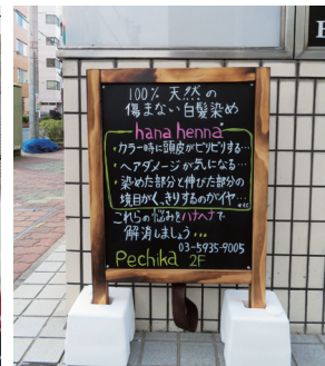
髪に優しいメニューが揃う