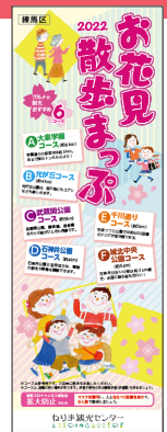
お花見散歩まっぴ (なくなり次第配布終了)

ねりま観光案内所 練馬区練馬 1-17-1 Coconeri 3F ☎03-3991-8101 営 9:00～21:00 休 年末年始