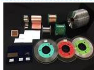
精密技術で仕上げられた製品