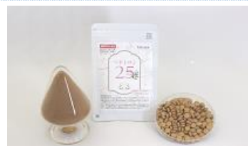
当社の原料を使用した機能性表示食品