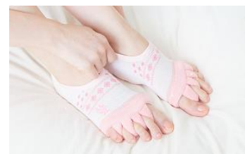
足指のリラックスアイテム