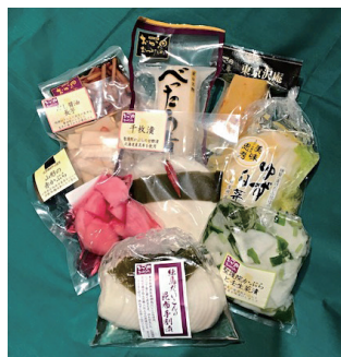
旬の漬物が常に50種類