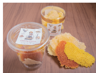
巣ごもり需要で人気のオードブルセット(左)とチーズガレット(右)