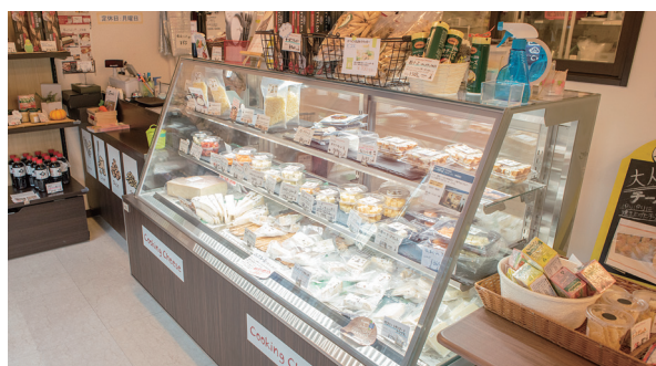
多種類のチーズやスイーツが並ぶショーケース