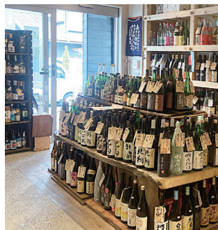
様々な地酒が並び店内