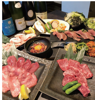
店主の目利きで仕入れる特選カルビ