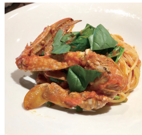
ワタリガニを使ったパスタ