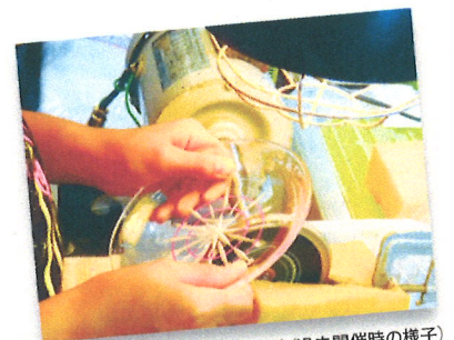
江戸切子制作体験(過去開催時の様子)