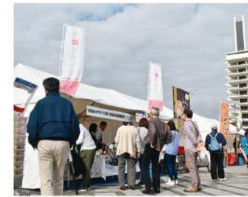
各地で開催されるイベントや催事にも世田谷みやげのお店が出店しています

「世田谷みやげ」は世田谷にゆかりのある商品ばかり。世田谷みやげの各店舗で購入することができるほか、常時数種類の指定商品を取り扱っているスーパーマーケット等なら、様々な「世田谷みやげ」のまとめ買いも可能です。