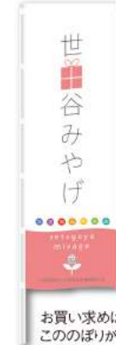
お買い求めはこのぼりが目印