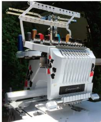
オリジナルのカスタマイズが施されたマシン

仕事でも使える「エレガントで上品な服作り」からスタートしたリフルシャッフル。某ファッション誌に取り上げられたことがきっかけで、ゴシック系ウェア主体へと変化していったそうです。前回掲載時は、そんなフリフリ・ゴシック系ショ