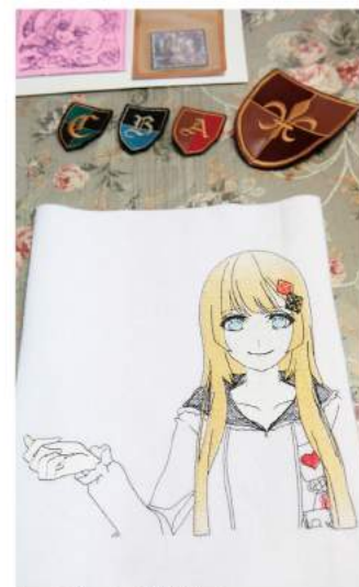
キャラ縫い®で表現された「王女 シャッフル」

そうした周囲との関わりのなかから生まれたキャラクターが「王女 シャッフル」です。日本の文化発信地のひとつである下北沢に店舗を構えていることから、外国人にも注目されるクールジャパンキャラクターとして企画。単にお店のイメージモデルだけではなく、世田谷の活性化に貢献できるキャラクターを目指しています。得意の刺繍を用いた「『演劇の街 下北沢』お土産トートバッグ」が、世田谷みやげに指定されているリフルシャッフル。「王女 シャッフル」が区の人気キャラクターとして活躍する日も近いかもしれません。