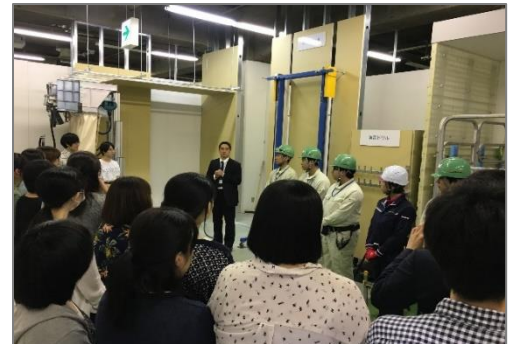
学生が中小企業の魅力を伝える映像・企画を制作しました！

東京商工会議所では、会員大学・専門学校4校と連携して、中小企業の魅力を発信するプロジェクトを昨年4月から開始いたしました。参加学生には、中小企業の底力・魅力を学生の柔軟な感性と視点で発掘して、同世代の若者にPRする映像や企画を制作していただきました。