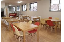
休憩室や食堂等の整備に係る建物附属設備等が対象に