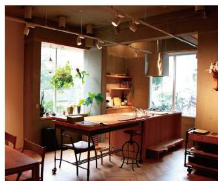
数々の作品が並んだショールーム 最近はおオーダーキッチンの人気上昇中とのこと

普段なにげなく使っている暮らしのパートナー「家具」。毎日使うものだから、自分だけのこだわりや使い勝手を反映できたら素敵ですよね。そんな思いを叶えてくれるのが、グッドデザイン賞を受賞したこともあるアンブインテリアデザイン。無垢の木材など自然素材を活かしたデザインが特徴で、個人ユーザーの特注品から、飲食店などのトータルコーディネートまで手掛けるオーダー家具の専門店です。