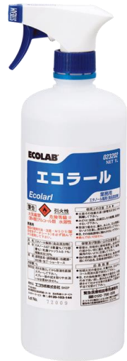
業務用 エタノール製剤 エコラール (食品添加物)

全社一丸で、“ 社内一斉除菌清掃 ”を実施する。 自分の職場は自分で除菌 (週末や、一斉休日前日の実施)