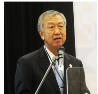
特別講演を行う宮川大使

宮川大使は、特別講演の中で両協議会の40周年を祝うとともに、両国の協力関係のもと、ビジネスの未来への取り組みは機会に満ちていると強調し、電気、水道、通信、交通、金融などのインフラ分野と、拡大を続けるASEAN市場の開発の分野で協力できると提案した。