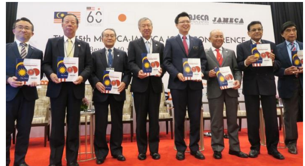
40周年記念本を発刊

チュア・ティール・ヨン マレーシア国際通商産業副大臣による基調挨拶をはじめ、宮川大使による特別講演のほか、マレーシア日本経済協議会の40周年記念本の発行セレモニーが行われた。