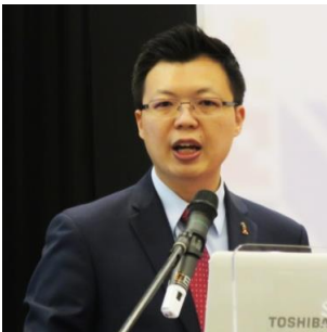
チュア・ティー・ヨン国際通商産業副大臣による基調挨拶

続けて、宮川眞喜雄マレーシア日本国大使が安倍晋三日本国内閣総理大臣の祝辞を、アブドゥル・ハミド・エゴーマJ E C A副会長がナジブ首相の祝辞を代読した。