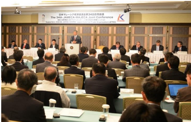
ザヒド・ハミディ副首相による基調挨拶

今回の合同会議には、両国協議会メンバーを中心に総勢183名が参加し、「日本・マレーシア間の経済のコラボレーションの強化と深化」をテーマに活発な議論を行った。