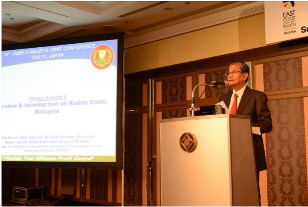
ク・アブドゥル・ラフマン・ク・ビン・イスマイル ケダ州エグゼクティブ・カウンセラー

電子産業の日本企業も入居するクリム・ハイテクパークや統合漁業ターミナル、科学技術パーク、ラバーシティといった工業団地の紹介を行った。また、ユネスコ・ジオパークに認定されたランカウイ島をはじめとした観光分野における投資機会についても言及、「日本の旅行業関係者には、ぜひ同州へのトラベルパッケージに目を向けてほしい」と述べた。