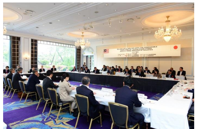
ラウンドテーブルミーティング

合同会議開催前にはアーマド・ザヒド・ハミディ マレーシア副首相とのラウンドテーブルミーティングを開催し、当協議会メンバー16名が参加した。参加した日本企業から寄せられたマレーシア政府への質問・要望に対して、ハミディ副首相自ら回答を行った。