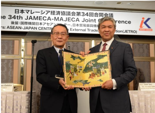
ザヒド・ハミディ副首相に記念品を贈呈

基調挨拶では、アーマド・ザヒド・ハミディ マレーシア副首相が、製造業分野では日本がマレーシアへの最大の投資国であり、電気・電子、非鉄金属、石油化学など幅広い分野で昨年未までに3,362件のプロジェクト、329億ドルの投資がなされ、451,387人の雇用を生み出していることを紹介。ASEANの中心に位置する地理的優位性、実用的でビジネスフレンドリーな政策、発達したインフラと接続性により、マレーシアは巨大なASEAN市場への玄関口となるとして、ハイテク産業、資本集約型産業、高付加価値型産業、知識ベース産業、技能集約型産業、輸出志向ビジネス等といった分野で日本の投資を歓迎すると述べた。